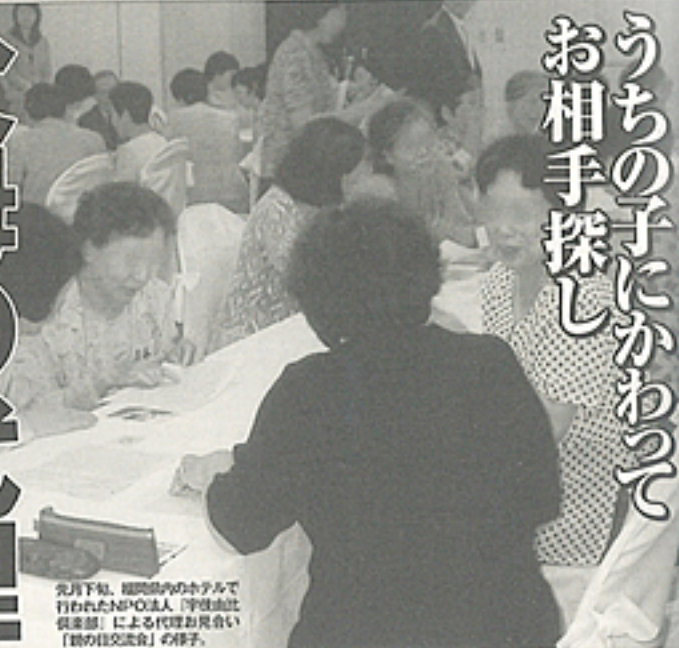
先月下旬、福岡市内の小ホールで行われたNPO法人「仲良しお見合い倶楽部」による代理お見合い「目的社交会」の様子。

「大卒、給料よし、性格だって悪くないのに…」 結婚しない子供に焦る親と、 「いい人がいたら」自分では探せない子の荒技？