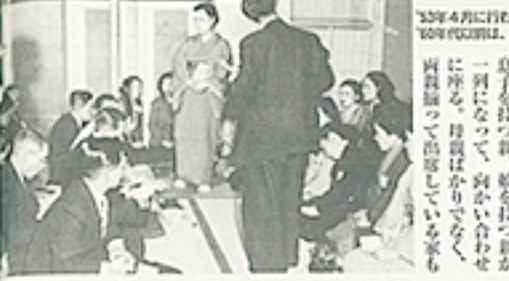
33年4月に行われた「親戚さん」の様子。30年代以降は、50%以上の見合い結婚だった。

「うちの子どもは、いい人がいたら、自分では探せない」と嘆息を吐く親。一方、結婚しない子供に焦る親と、「いい人がいたら」自分では探せない子の荒技？ 「うちの子どもは、いい人がいたら、自分では探せない」と嘆息を吐く親。一方、結婚しない子供に焦る親と、「いい人がいたら」自分では探せない子の荒技？